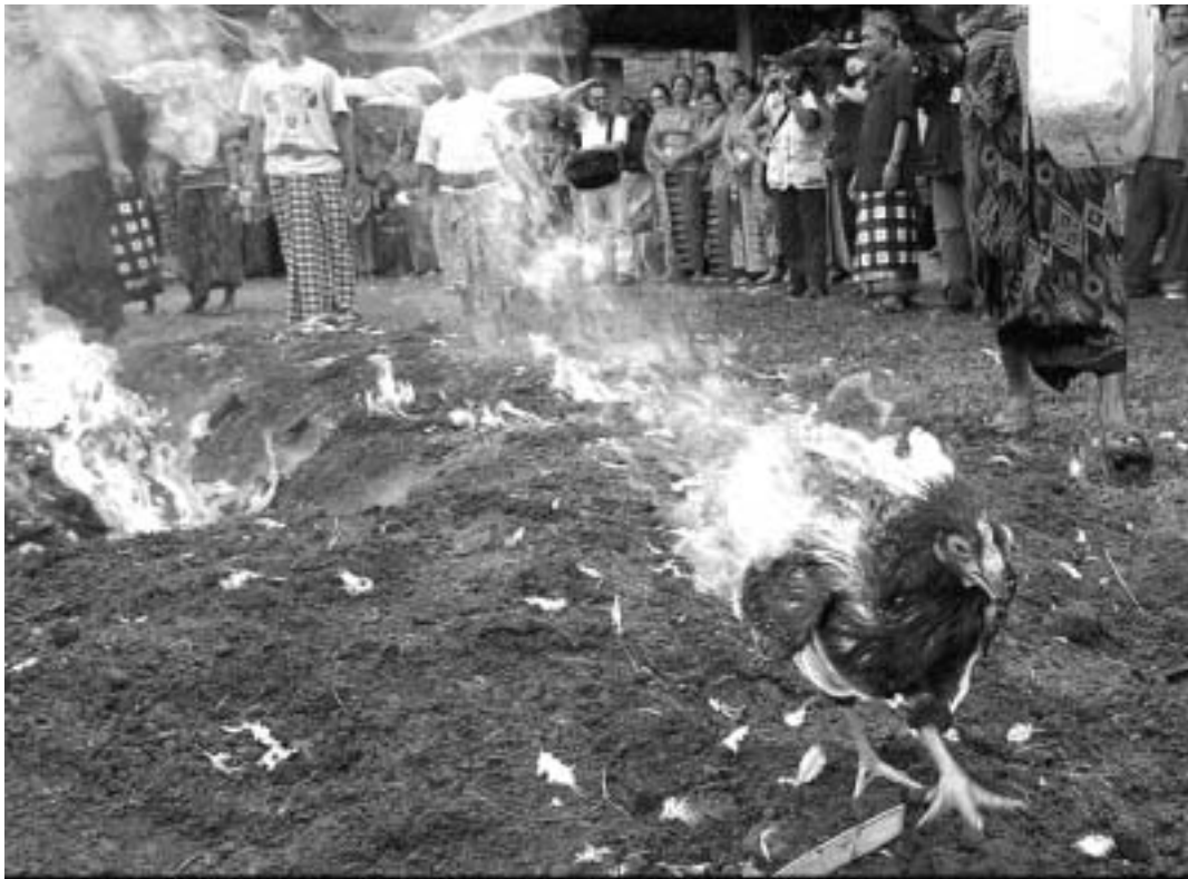
Poules et poulets brûlés vifs en Asie pour éviter une humanisation de l'épidémie de grippe aviaire.